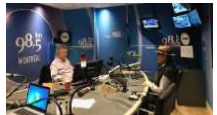
Novembre 2018 : Interview radio par l'autre journaliste radio vedette de Montréal, Paul Arcand sur 98.5 FM de Montréal!