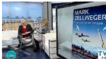
Novembre 2018 : Présentation de Pour tout l'or de Srinagar par la star du polar Québécois, Chrystine Brouillet à la télé TVA de Montréal.