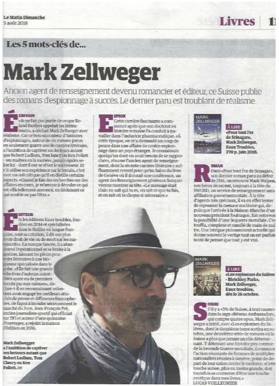
Août 2018 : Article dans le journal du dimanche en Suisse, Matin dimanche.