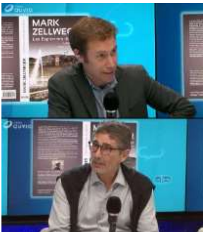
Mai 2018 : Interview par un des journalistes vedette de la RTBF Bruxelles.