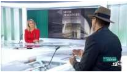
Octobre 2017 : Télé journal télé suisse RTS1.